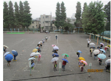
6月1日の登校時、昇降口に整列している子供たち

いよいよ本日、6月1日(月)から段階的にはありますが、学校再開となりました。第1、2週目は、各クラスを2グループに分けて分散登校となります。午前・午後の時間に分かれて、2時間または、3時間授業を実施いたします。通常の登下校時間と異なるため、交通安全が心配されます。通学路の各ポイントには学童擁護員や教員も立って安全指導を行います。自宅付近で登下校の様子を見守るなど、保護者の方の御協力がいただけましたら幸いです。