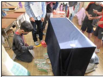
3-1 ワニワニパニック、はてなボックス、スパイダーコース