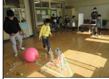
コスモス 80周年ボーリング