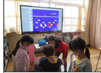
4-2 お題をクリアしろ！ ～4-2 からの挑戦状～