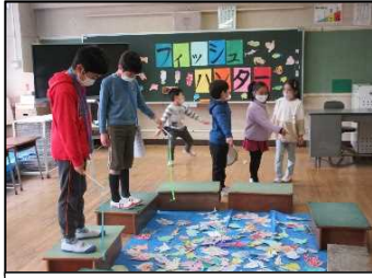
1-1 フィッシュハンター