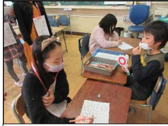
2-1 なぞとき脱出ゲーム