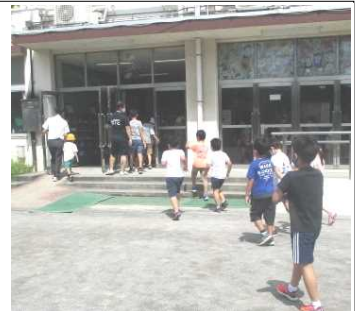
休み時間、自分たちで時間を考え校庭から教室に戻る子供たち。

今「鐘の鳴る丘」では、子供たちの「心の鐘」が響きわたっている。(開校40周年記念誌より)