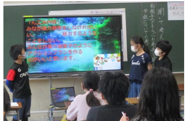
自分たちの学級を改善していくプランを、タブレットのスライド機能を活用し発表する6年生。写真は「人と人のかかわりを見直そうプロジェクト」提案の場面。

本校においても、いじめアンケートを実施し、必要な児童への面談と、それに対応した組織的な指導を行っていきます。また、全校での「あいさつ運動」や、5月から引き続きスクールカウンセラーとの全員面接（5年生）などの取組を実施します。さらに、この期間には、道徳科の授業で「友情、信頼」の内容をはじめ、「相互理解、寛容」「親切、思いやり」「公平、公正、社会正義」等、人と人のかかわりにおいて大切な道徳的価値を含んだ内容の学習を計画的に行います。道徳で心を耕したこととふれあい月間における様々な実践が響き合って、子供自身が自分とのかかわりで考え、自己の生き方について自覚を深めていけるとよいと考えています。