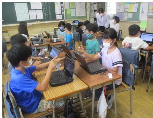
3年生 国語の研究授業風景：タブレットで意見を共有し、比較・分類しながら考えをまとめています

さて、今年度本校では、子供たちが主体的に学び、全員がすすんで自分の考えを発言できる授業を目指して、校内研究を進めております。ふだんの授業の様子を見て回ると、どのクラスも落ち着いて学習に取り組んでいるのですが、発言する子供が一部の子に限られているようなことがあります。もちろん、子供の性格を考えれば、人前で話したり、発表したりすることが苦手な子がいても仕方ありません。しかし、いつも一部の反応の早い子供の発言だけで授業が進められていると、その他の子供たちの学習態度がどうしても受け身になりがちです。学習が得意な子、発言力のある子供だけではなく、全員の意見や考えを生かして進めていく授業に