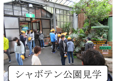
シャボテン公園見学