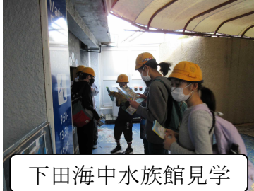
下田海中水族館見学

1日目の下田海中水族館の見学は、天候にも恵まれ、ショーや館内の見学、お土産の購入などを楽しみました。宿舎では、3Dスタンドづくりや海藻押し葉しおりづくりをしました。2日目は、残念ながら悪天候により、予定していたシャボテン公園での見学が限られたエリアのみの行程になってしまいました。しかし、小学校生活での最初で最後の移動教室を経験できたことは、この先の彼らの学校生活にきっとつながるものになると信じています。中学校生活へ生かしてほしいです。