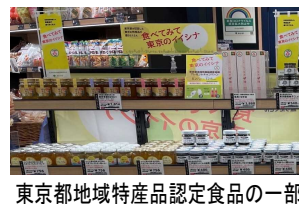
東京都地域特産品認定食品の一部