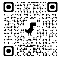
練馬アニメーションサイト公式チャンネル

最後にちょっぴりうれしいお知らせです。現在「練馬アニメーションサイト公式チャンネル」で公開中の「開校 80 周年記念アニメーション児童集会」(昨年度制作)が、公益財団法人教育美術振興会の方の目に留まり、「教育美術 3 月号」で紹介されることになりました。COLUMN「アニメが見つないでくれた開校 80 周年へのおもい」として、2 ページにわたり掲載されています。原稿を執筆しながら、コロナ禍で困難な状況の中でも、保護者・地域の皆様と学校が、心一つにして挑戦し続けた日々を懐かしく思い出しました。残念ながら、ここに本文を載せることはできませんが、まだ、アニメーションを御覧になっていない方は、この機会に御鑑賞いただけますと幸いです。子供夏祭りの花火をメインテーマに、全校児童が描いた力作です。