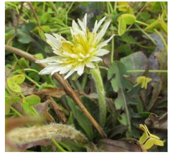
校庭に咲く、可憐なシロバナタンポポ

子供たちの明るい声に誘われ、春を探しにゆったりと校庭を歩いてみました。日当たりのよい花壇には、水仙、オオキバナカタバミ、ヒメリユウキンカなどの花が咲き誇っています。その中で、ひっそりと咲く一輪のシロバナタンポポを見付けました。名前のおり白い花卉を付ける在来種のタンポポで、この辺りでは滅多に見かけることはありません。どんな縁でここに根を下ろしたのでしょうか。思いがけない発見に、宝物を見つけたときのような喜びを覚えると同時に、長く厳しい冬を耐え抜いて美しい花を咲かせた植物に、敬意を感じずにはられませんでした。