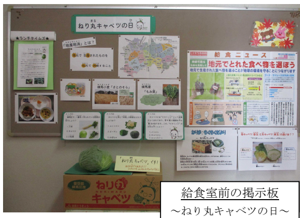
給食室前の掲示板 ～ねり丸キャベツの日～

これからも、安心安全でおいしい給食を提供するとともに、給食を通して多くのことを学べるよう取り組んでいきます。