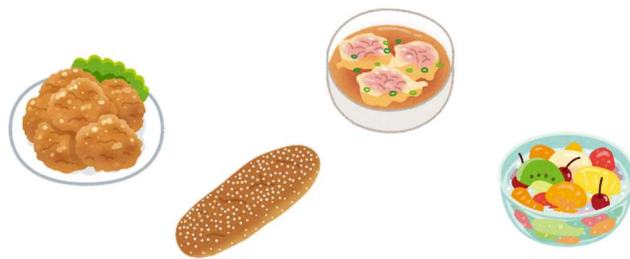
<2月の食材の主な産地(予定)>