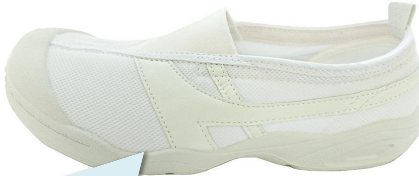
アキレス 吸圧シューズ J E S 2 1 0 1 2, 4 8 0 円

すぐ大きくなる子供の足。しかし、長時間履くこと、体育や校内での移動を考え、安全・健康を考えた上履きを履かせてあげてください。