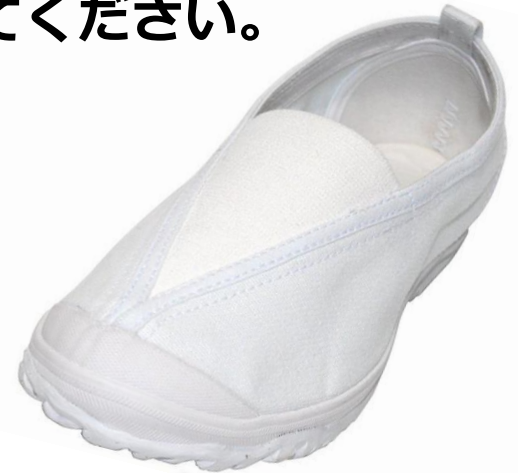
学進シューズ C 2 2 型 1, 8 5 0 円