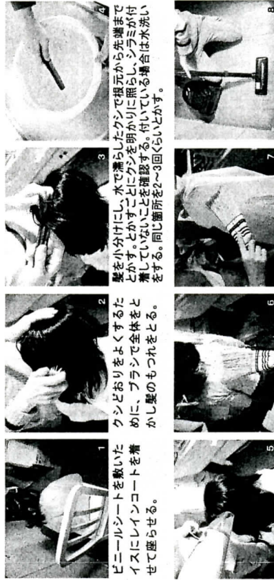
髪をすべととかし終えた後、ドライヤーで乾かす。 1. ビニールシートを敷いたイスにレインコートを着せて座らせる。 2. クシどおりをよくするたに、ブラシで全体をとかし髪のもつれをとる。 3. 髪を小分けにし、水で濡らしたクシで根元から先端までとかす。とかすことにクシを明かりに照らし、シラミが付着していないことを確認する。付いている場合は水洗いをする。同じ箇所を2~3回くらいとかす。 4. 髪を洗い流す。 5. 濡れた髪を乾かす。 6. コートを脱がせ、洋服にハケをかける。 7. コートやシートにハケをかける。クシやブラシなどは水洗いをする。 8. 床に掃除機をかける。取れたアタマジラミや髪はゴミ箱に捨てる。 9. ハケをかける。 10. 床に掃除機をかける。

10日間、大人がとかしてあげましょう。 クシはスキグシを使用すると、卵、幼虫、成虫を取り除くことができます。スキグシが入手できない場合には、卵や幼虫を完全に除くことはできませんが、できるだけ目の細かいクシで代用し、成虫を取ってあげましょう。