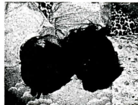
お昼寝や添い寝のとき