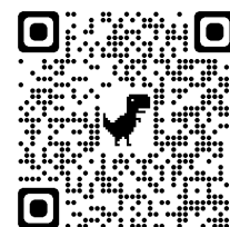
保護者アンケート QR コード

体育発表会に御参観の保護者の皆様に、アンケートをお願いしております。本校の教育活動をより良いものにしていくためのアンケートです。右のQRコードを読み取り、回答してください。御協力のほど、よろしくお願いいたします。