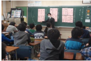
開進第四中学校出前授業