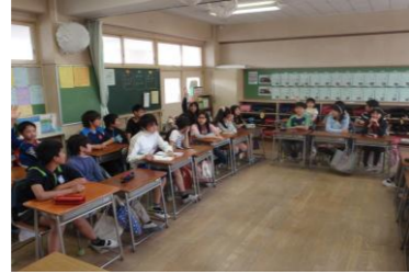
学級活動の話合い