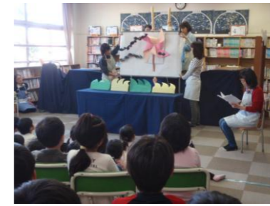
図書ボランティアによるお話し