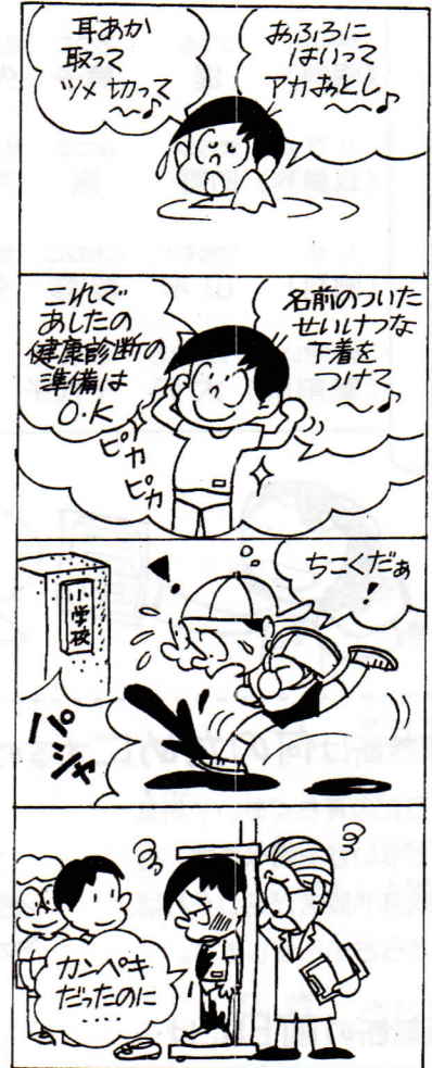
けんこうしんだんよていひょう 健康診断予定表

色々な提出物や、用意する物などがある検診もあります。忘れ物をしないように気をつけて下さい。また、詳しい検査が必要な時や、病院に行った方がよい場合はお知らせしますので、なるべく早くかかりつけのお医者さんに行くようにして下さい。何か心配事や、わからないことがある場合は、保健室に連絡して下さい。