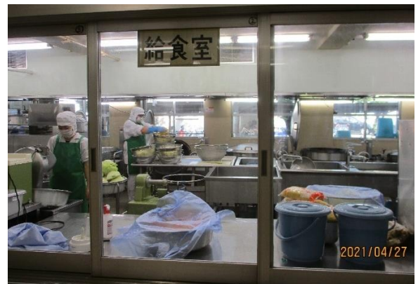
【給食室で調理している様子】

一つには、給食をよく食べることです。昨年の9月から残菜が減り、どの学級もしっかりと食べる姿がありました。今年度もそれが継続しています。食事が体を作り、体力を身に付ける一歩であり、体力があると心も元気になっていくと思います。給食が苦手なお子さんは少しずつでよいので食べられ量が増えるとよいと思います。家庭での協力をよろしくお願いいたします。