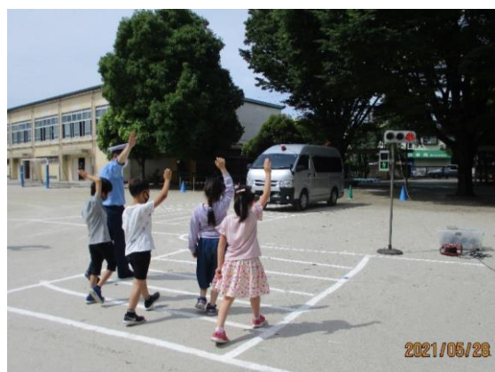
【信号機に従って、歩きました】

雨の時期は交通事故も増えるときです。5月28日に、校庭と教室で、交通安全教室を行いました。1年生は歩き方を、3年生は自転車の乗り方を中心に、練馬警察の方お二人からご指導をいただきました。2年生は教室でDVDを見て学びました。改めて、信号機の青や赤の意味について、また自転車では、一時停止をしっかりとすることや右左に加えて後ろも確認することなどについて丁寧に教えていただきました。直接警察の方から「自分の命は自分で守ることが大切」と教えていただき、子供たちもさらに真剣に交通安全のことを考えるきっかけとなりました。1年生も3年生も校庭での活動に集中できていたので、これから地域でもしっかりと取り組めたらよいと願っています。