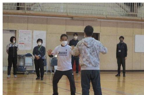
【相手の動きを見て、対称的に動く】

1月26日に、コーディネーショントレーニング普及研修会を行い、他校から15名の先生方にZoomにて参加していただきました。「コーディネーショントレーニング」の講義の後で、実技として、「くの字運動・Sの字運動」のポイントを習い、また2人組で、ボールを使って同時に隣に移動して受け取るなどを行いました。次に、相手を見て、鏡のように動くこと、さらに、相手の動きとは対称的に動くこともして、頭がフルに活動しているのがわかりました。この研修で学んだ健康と運動の大切さを、子供たちに指導していきます。