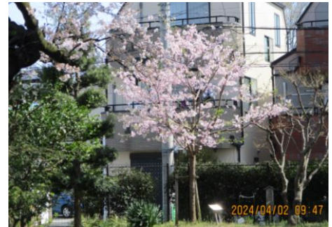
【北側にある桜が満開に】

お子様のご入学・ご進級おめでとうございます。本日、141名の1年生を迎え、全校児童794名25学級での出発の日となりました。そして、新しい担任や新しい友達と出会い、新年度が始まりました。