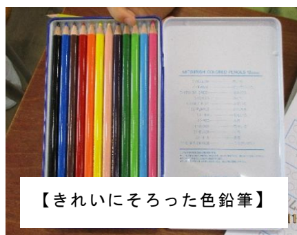
【きれいにそろった色鉛筆】

1年生の教室を訪れると、明るい挨拶が返ってきます。元気があり嬉しいなと思っています。と、きれいにそろった色鉛筆が目に入りました。名前も一本一本に書いてありました。