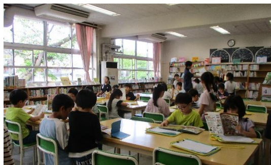
【図書室で、読書をする3年生】

さらに、3年生の学びの様子もお知らせします。3年生以上の学年では、火曜日や金曜日の朝に、仲町っ子タイムという短時間で国語や算数を学習しています。読書旬間の時には、この時間も読書をして本に親しむ活動を行います。また、本校では、火曜日の宿題を読書にしているので、家庭でも本を開いて、楽しく語彙を増やしてもらいたいと思っています。そしてどんな本を読むのかも大事だと考えています。宿題の読書では、国語の教科書に参考として載っている本や物語の筆者が書いた他の本、図書館から出ているおすすめの本などがよいと思います。もちろん、宿題以外の日には、自分の好きな図鑑や面白い絵本を見るのもよい時間だと考えます。火曜日の宿題については、どのような本を読むのか、読んだ後にどう振り返るのか各学級で指導して、充実できるようにしていきます。低学年では、ぜひお家の方の読み聞かせも、お時間のある時にお願いします。とても心が落ち着き、他の学びに対しても意欲が増すようです。結びになりますが、連休中も、安全に楽しく過ごされ、5月の学びにつなげていただければと願っております。