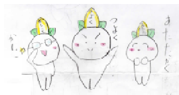
開校70周年記念マスコット 「南小レンジャー！」

目指す学校像 <教育理念> 自立・共生 <教職員の心構え> 共育・迅速（組織力と機動力）