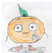
開校70周年記念マスコット

目指す学校像 <教育理念> 自立・共生 <教職員の心構え> 共育・迅速（組織力と機動力）