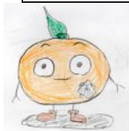
開校70周年記念マスコット