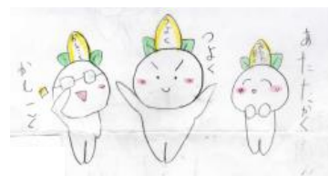
開校70周年記念マスコット 「南小レンジャー！」