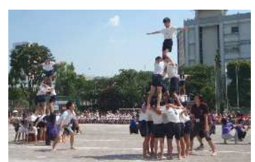
演 JOY 組み体操

どの技も心を一つに真剣に取り組みました。練習で苦戦していたタワーやピラミッドも全て成功させ、最高学年の力を見せました。