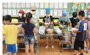
(たてわり班給食 配膳の様子)

私はいろいろな学校でたてわり班活動を見てきましたが、ここまで児童が主体的に動ける班活動は珍しいです。これまでの活動の積み重ねが生きています。大事にしていきたいと思います。