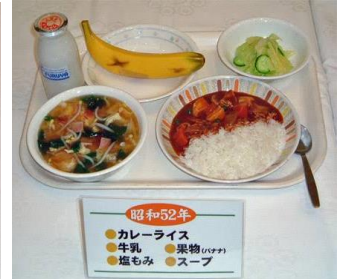
昭和52年 ●カレーライス ●果物(バナナ) ●牛乳 ●塩もみ ●スープ

学校給食は明治22年に山形県鶴岡町で、貧しくて生活に困っている児童を対象に昼食を出したことが始まりだと言われています。