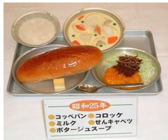
昭和25年 ●コッペパン ●コロッケ ●ミルク ●せんきゃべつ ●ポタージュスープ