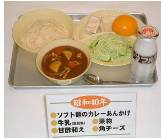
昭和40年 ●ソフト麺のカレーあんかけ ●牛乳(ほろ) ●果物 ●甘酢和え ●角子ース