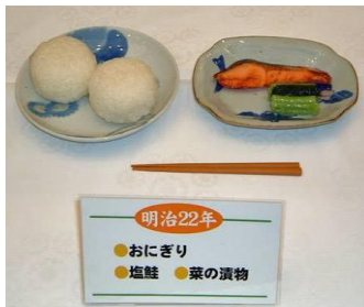
明治22年 ●おにぎり ●塩鮭 ●菜の漬物