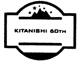
開校60周年記念ロゴマーク