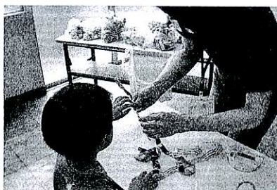
ハンガーに布を巻いて・・・