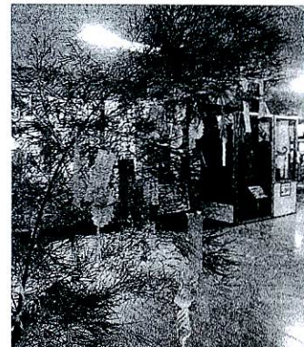
大きな笹につるしました