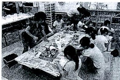
どんな飾りを作ろうかな

立野小学校「たてのっこひろば」では、7月に「七夕工作」を行いました。当日は、色紙を使って七夕のお飾りや願いごとを書いた短冊を作りました。子供たちは、完成した作品を笹につるして、七夕を楽しんでいました。