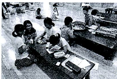
ひろばで宿題もやっちゃおう