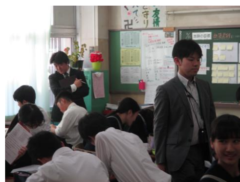
小・中学校教員の授業実践