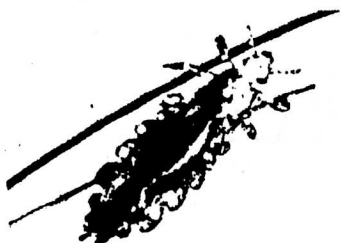
アタマジラミの成虫

アタマジラミは、人の血を吸って生きている昆虫です。頭髪に寄生して頭皮から吸血しています。アタマジラミの卵は長径0.9mmの楕円形で産卵の際に分泌物とともに毛髪に強固に固定されます。卵は10日間で孵化し、幼虫は2週間ほどかけて3回脱皮し体長3~4mmの成虫となります。アタマジラミは毎日数回吸血します。吸血の際、注入される唾液に対するアレルギー反応により強いかゆみを感じます。メス成虫の寿命は、約1ヵ月間でその間毎日数個の卵を産みつけます。