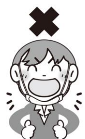
あごにつけている

<保護者の方へ> *11日（木）から19日（金）にかけて、学年ごとに身体測定を実施します。 中旬から下旬にかけて、測定結果を個人用の封筒に入れてお渡しします。 測定結果は、ご家庭で保管していただき、封筒は学校に返却してください。