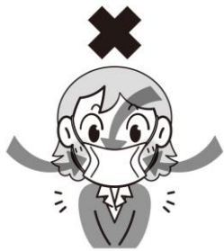
すき間があいている