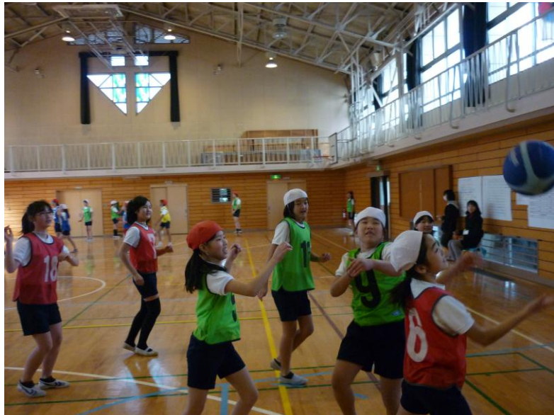
5、6年生のお別れ球技大会