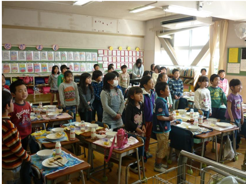
給食中に行われた子供たちだけで企画した先生のお誕生日会

例年より早く咲いた桜の花が一年生の入学を見届けようと頑張る中、新しい学年のスタートを迎えました。