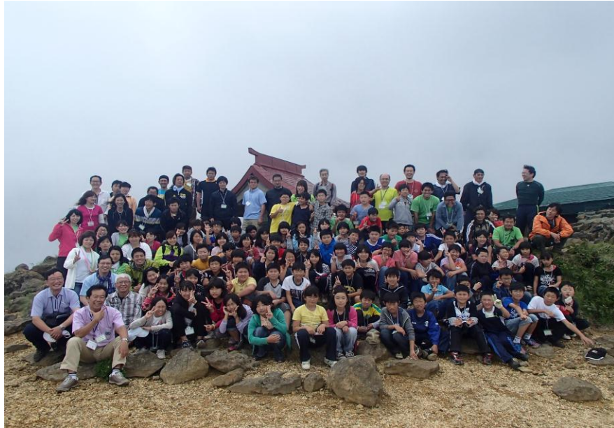
蔵王町立永野小学校の皆さんと熊野岳山頂にて