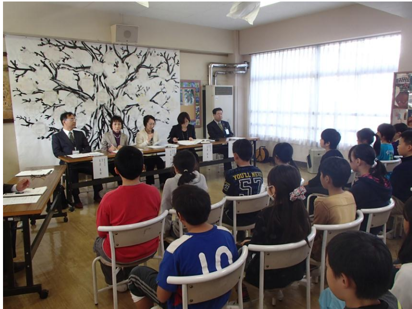
練馬区教育委員会教育委員と6年生との意見交換会

平成二十五年もいよいよ最後の月を迎えました。 私自身、この一年を振り返ってみると、「東北」とのつながりが多かった年だと感じています。 「あまちゃん」「八重の桜」といったドラマに夢中になったり、東北楽天ゴールデンイーグルスの優勝に興奮したりしました。 七月には、蔵王町立永野小学校との学校間交流で、両校で海沿いにある亘理町立荒浜小学校に行きました。 土台しか残されていない町並み、「ここまで津波が襲ってきた。」と教えていただいた階段に残された津波のあと。震災から二年たった町や学校の様子を見て、聞いて、東日本大震災のことをほんの一部分かもしれませ