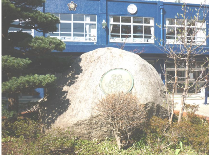
100周年のお祝いに贈られた大石（今年138周年を迎えます）