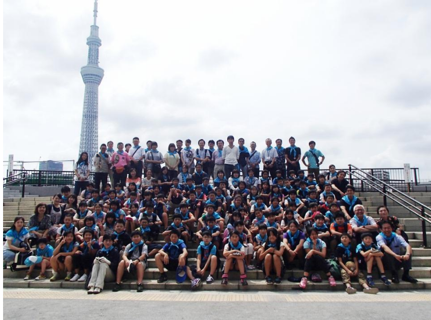
蔵王町立永野小学校の皆さんとスカイツリーをバックに

長い夏休みが終わり、元気な子供たちの姿が学校に戻ってきました。猛暑、雷雨、集中豪雨、水の事故、交通事故、不審者等、心配なことも多く、とにかく元気にまた学校に戻ってきてほしいと願う夏休みでした。