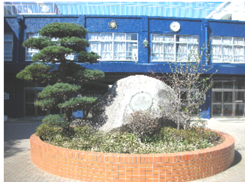
開校100周年記念碑の通称「大石」が来校者を迎えます