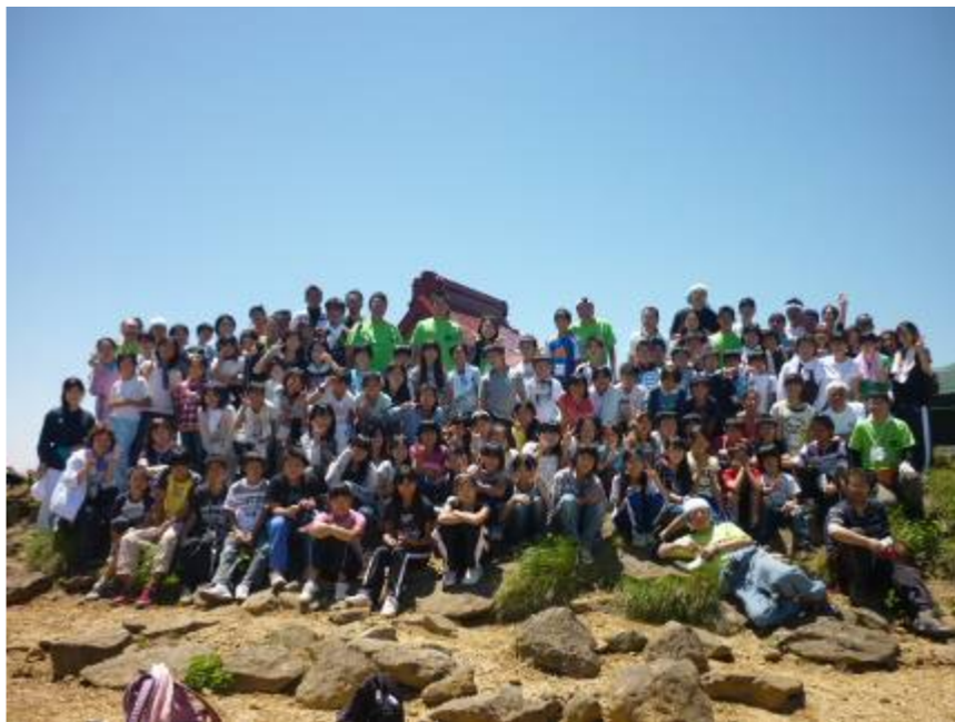
蔵王町立永野小学校の皆さんと熊野岳山頂にて (7月16,17日)