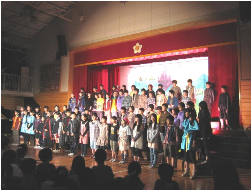
魔法をすてたマジョリン 6年生

いよいよ十二月に入りました。毎朝登校してくる子供たちの服装も、暖かいジャンパーやコートなど目立つようになりました。学校の木々も落葉し始め、夏の間にごやかだった学校農園も、今は大根の葉が茂っているだけでひっそりと静まり返っています。