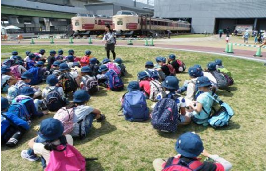
いろいろな電車などが展示してありました。3・4年遠足（鉄道博物館にて）