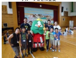
ざおうさまと一緒に