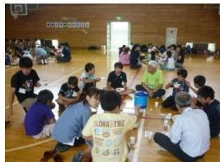
グループごとに昼食