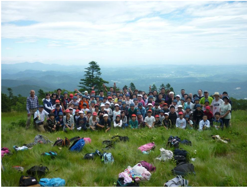
烏帽子スキー場頂上にて