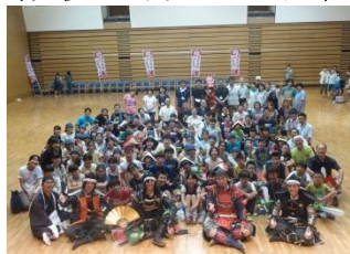
最後は全員で「ずんだもち〜」パチリ！

今日から再開される学校生活が、一人一人の子どもたちにとって、安全で楽しいものとなるよう教職員一同、力を合わせて参ります。保護者、地域の皆様、今まで同様、ご理解、ご協力を よろしくお願いいたします。 * * * 七月十八日、十九日は、毎年実施している宮城県蔵王町立永野小学校との学校間交流を行いました。今年も、豊溪小学校の五、六年生有志四十一名と豊溪小学校教員、保護者、地域の方二十二名の合計六十三名で蔵王に行つての交流を行いました。 永野小学校体育館において、出合いのつどいを行いました。6年生は昨年度交流しているの で、互いに声を掛け合つていました。昼食時は、カレーライスとチーズクリームをごちそうになり、「ざおうさま」と記念写真を撮りました。 その後会場を永野商工会議所に移し、「ちゃんばら合戦」を行いました。大人も子どもも一杯汗を流していました。宿舎は蔵王自然の家をお借りし交流を深めました。特に肝試しは協力し合っていました。 二日目は烏帽子スキー場登山を行いました。天候にも恵まれ楽しいひとときを過ごすことができました。 この交流活動のためにご尽力いただいた、蔵王町教育委員会、永野小学校の皆様、豊溪小学校ふるさと交流実行委員会の皆様に心より御礼申し上げます。