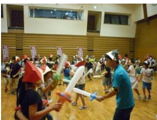
先生との真剣勝負