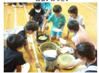
おいしかったカレーライス