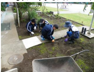
八坂中職場体験(2年)

学力は家庭学習でさらに向上します。保護者の皆様のご協力をよろしくお願いたします。