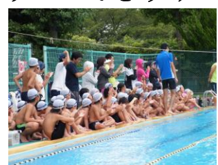
連合水泳記録会(6年)