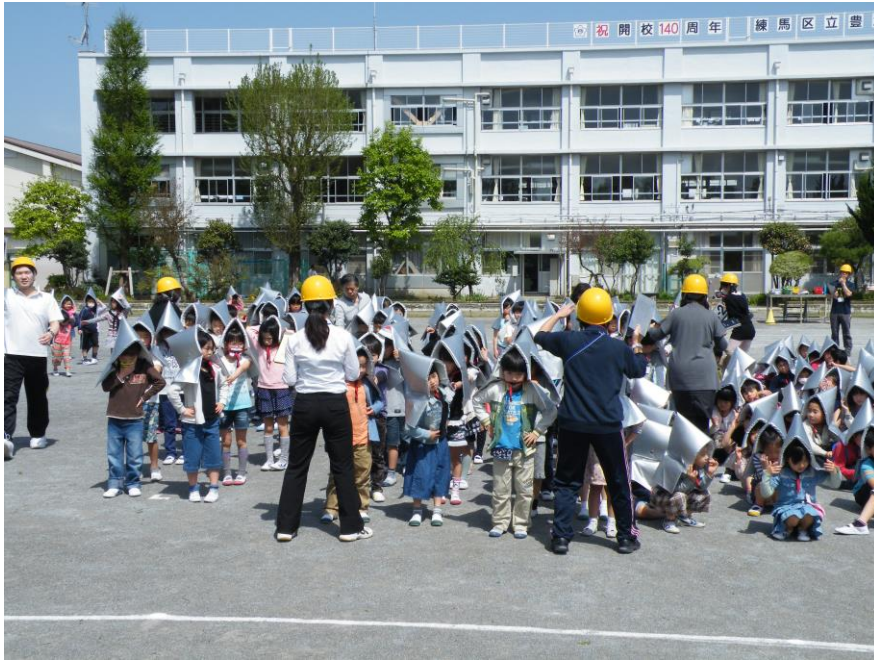
避難訓練『お・か・し・も』