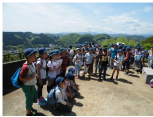
3・4年生遠足(名栗川・天覧山)