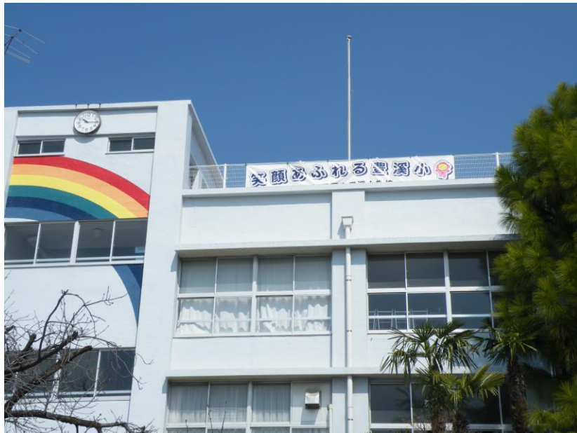
笑顔あふれる豊溪小