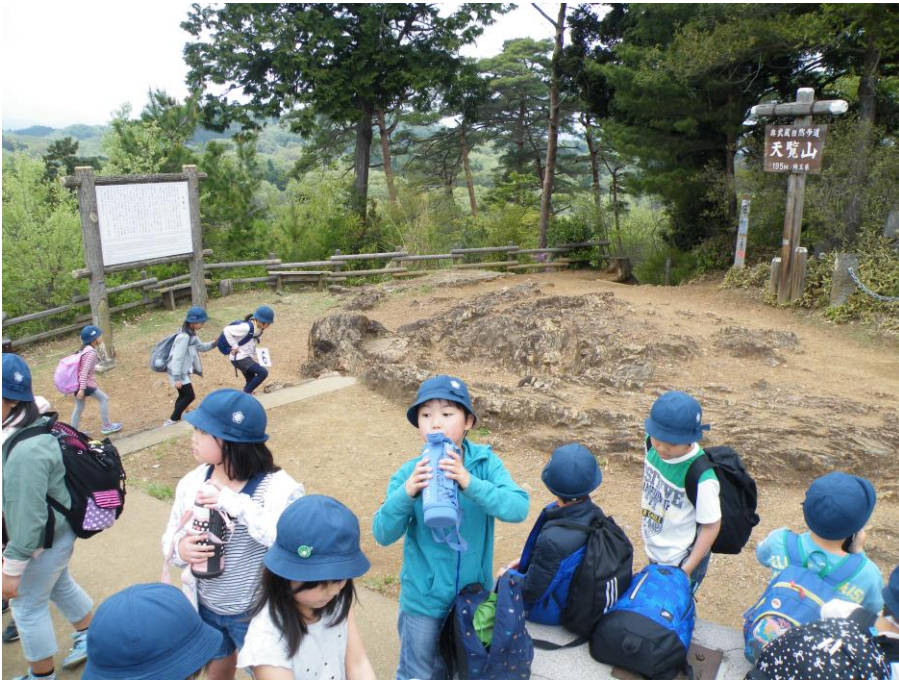
天覧山にて (3・4年生遠足)