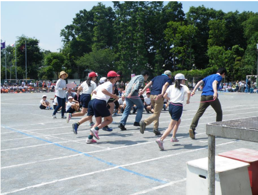
6年親子競技（障害物リレー）