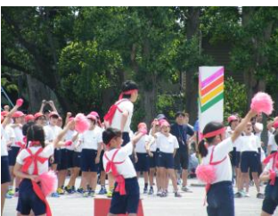
応援団中心に盛り上がりました

＊ ＊ ＊ 次に恒例となっている5・6年生の組体操「協力くやってみよう！」です。子供たちの体力の実態や、指導体制等について十分に検討した上で、確実に安全で実施できる範囲で行いました。練習時から子供たちは集中して演技していました。本番当日、5・6年生一人一人が気を引き締めて、最高の演技をしていました。 ＊ ＊ ＊ また、本校の特色の一つが全学年実施した親子競技です。全児童がご家族の方と一緒に競技する姿はとても微笑ましかったです。最後に応援合戦です。6年生の応援団長を中心に赤白どちらも声がかかるまで応援していました。 ＊ ＊ ＊ 早期より子供たちの頑張る姿を見るためにご来校いただいた、ご来賓の皆様、保護者・地域の皆様、ご声援ありがとうございました。また、自転車整理や警備、来賓接待、親子競技、片付け等ご協力いただいたPTAの皆様、ありがとうございました。