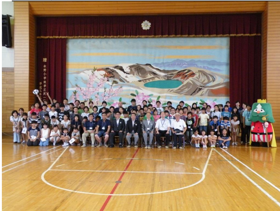
永野小学校の皆さんと一緒に

暑くて長い夏休みが終わり、子どもたちの元気な声が学校に戻ってきました。黒く日焼けした子どもたちは、普段の生活では味わえない貴重な体験を通して、一回り大きく成長して戻ってきたように感じます。二期は五年生の軽井沢移動教室、学会、豊溪祭り、社会科見学などがあります。一人一人がリーダーシップを発揮して、笑顔あふれる豊溪小学校を築いてもらいたいと思います。 * * * 七月十五日、十六日に、毎年実施している宮城県蔵王町立永野小学校との学校間交流を行いました。今年は、豊溪小学校の五、六年生有志三十一名と豊溪小学校教員、保護者、地域の方十八名で永野小学校へ行ってきました。