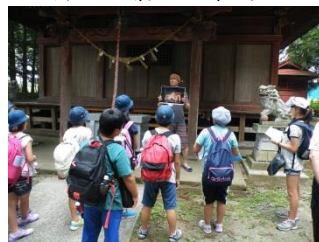
学区散策・水遊び