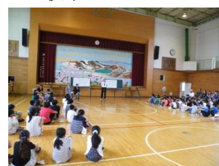
出合いのつどい・昼食