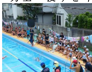
連合水泳記録会・師範授業