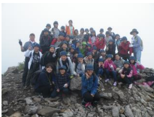
東麓ノ登山・松井農園