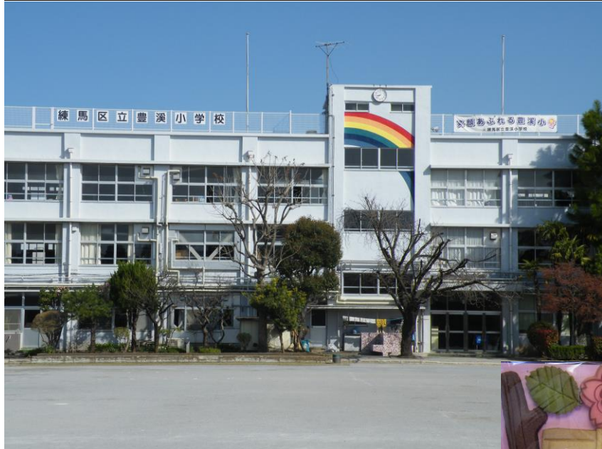
笑顔あふれる豊溪小