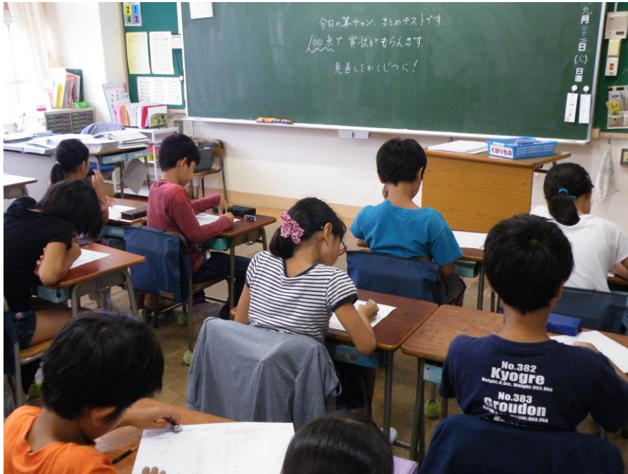
めざせ！算数チャンピオン（前期まとめテスト）

四月十七日に行われた全国学力・学習状況調査（六年）の結果が出ました。この調査は、全国の六年生を対象に、国語と算数と理科の三教科について、学力を把握し、今後の政策や指導の改善を図ることを目的に行われたものです。今回の結果も、国語、算数、理科ともに東京都、全国の平均を上回ることが出来ました。ただし、国語では、「読む」領域で東京都の平均と比べると3ポイント下回っています。「物語文から叙述を基に理由を明確にする」問題の正答率が低いことがわかりました。本校の校内研究は今年度から国語にシフトし、「学び合いの中で、思いや考えを伝え合う児童の育成」を研究