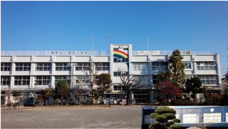
笑顔あふれる豊溪小